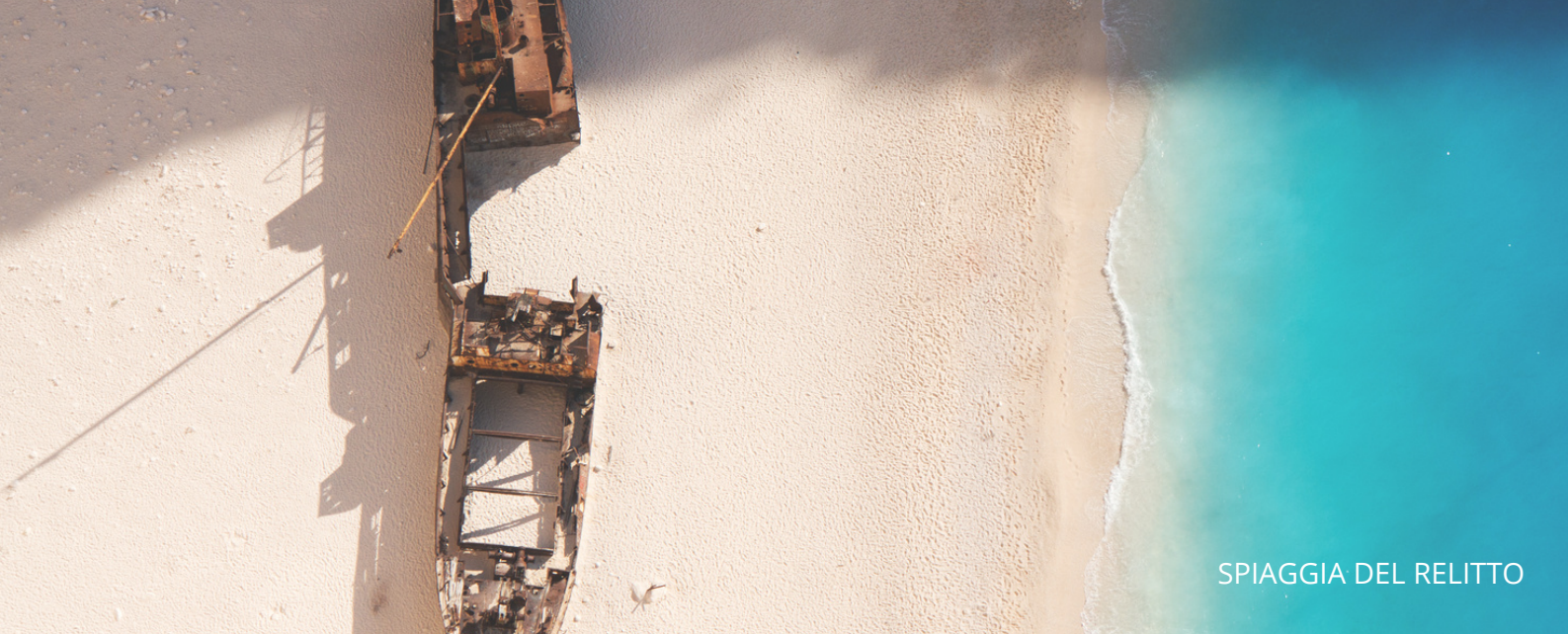
SPIAGGIA DEL RELITTO